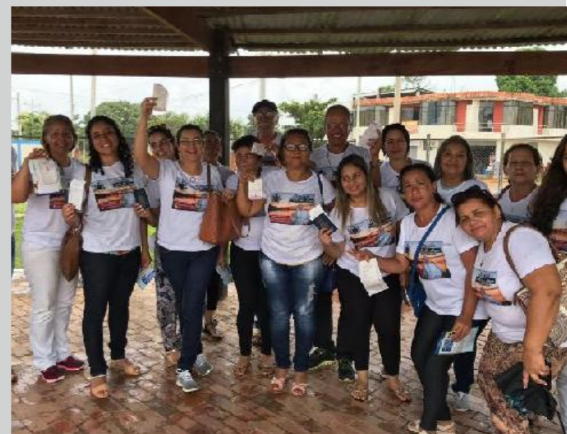
Feligreses brasileños, que viajaron a Puerto Maldonado para estar cerca al Papa, realizaron su control migratorio con rapidez.

En tanto, en Puno se fortalecieron los puestos de control fronterizo con 15 inspectores, para atender a los ciudadanos bolivianos o de otros países que ingresaron al Perú por ese lugar, para luego viajar a Madre de Dios.