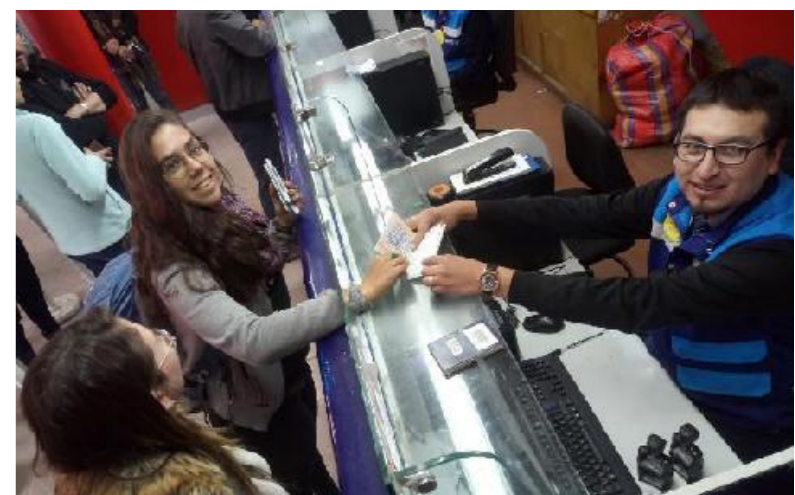
MIGRACIONES activó la TAM Virtual en el Puesto de Control Fronterizo de Desaguadero, en Puno, límite con Bolivia.

Adicionalmente, nuestra seguridad interna estuvo reforzada con el Sistema de Información Avanzada de Pasajeros - APIS, que permite conocer con anticipación datos de los pasajeros y tripulantes de los vuelos que ingresan al Perú.