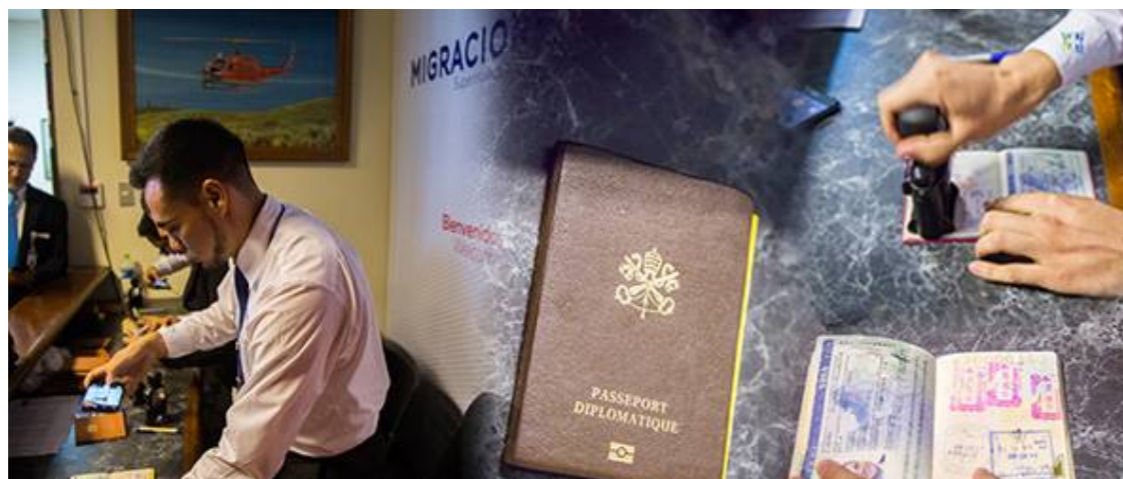
Inspectores especialmente capacitados realizaron el control migratorio de la delegación que acompañó al Papa Francisco. Ellos se instalaron en un ambiente especial del Grupo Aéreo N°8.

Desde las semanas previas a la visita papal, en el Aeropuerto Internacional Jorge Chávez se incorporó a 64 inspectores migratorios, que se sumaron a los 153 que laboran habitualmente, con la finalidad de