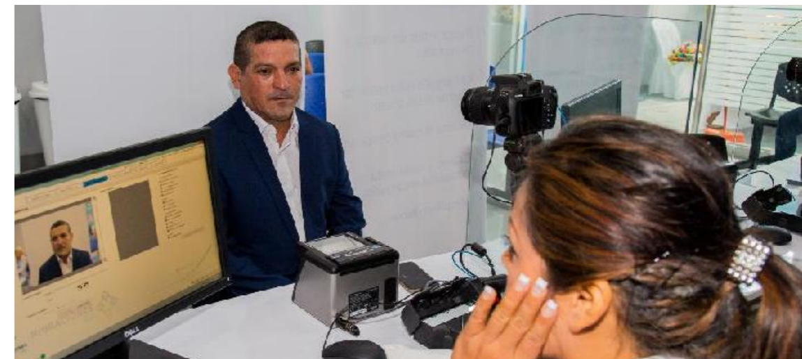
La Jefatura Zonal Tarapoto funciona desde noviembre pasado para una atención más cercana a los ciudadanos de la selva central. Los extranjeros también pueden hacer sus trámites en esta sede.

Y en Ventanilla, con el municipio distrital y la Presidencia del Consejo de Ministros, se posibilitó la presencia de MIGRACIONES en el Centro de Mejor Atención al Ciudadano - MAC.