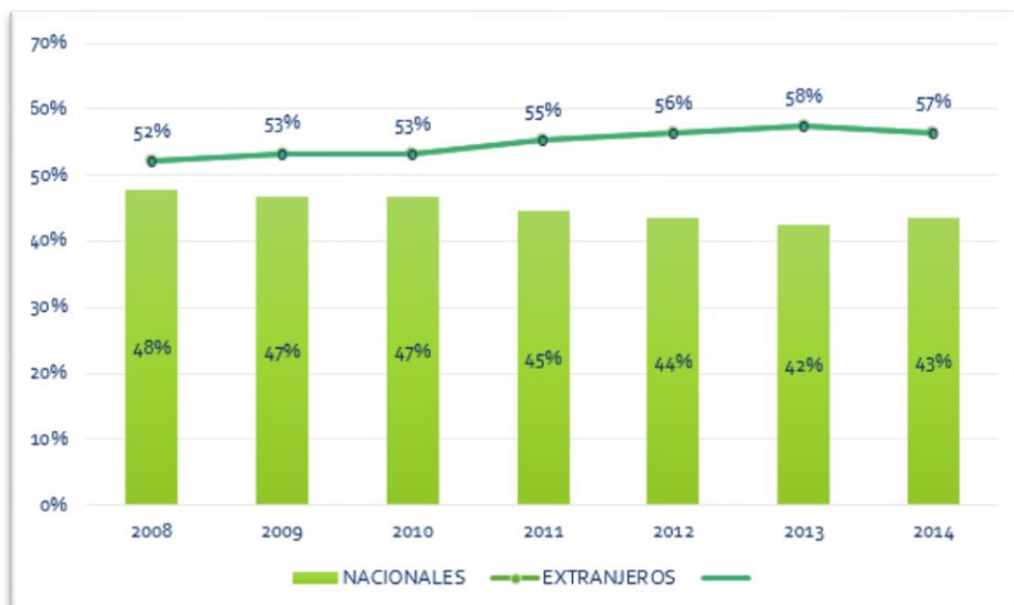
GRAFICO N° 5 CONTROL MIGRATORIO A NIVEL NACIONAL 2008-2014

Fuente: Información extraída de la Base de Datos de la Superintendencia Nacional de Migraciones Elaborado: Oficina General de Planeamiento y Presupuesto/MIGRACIONES