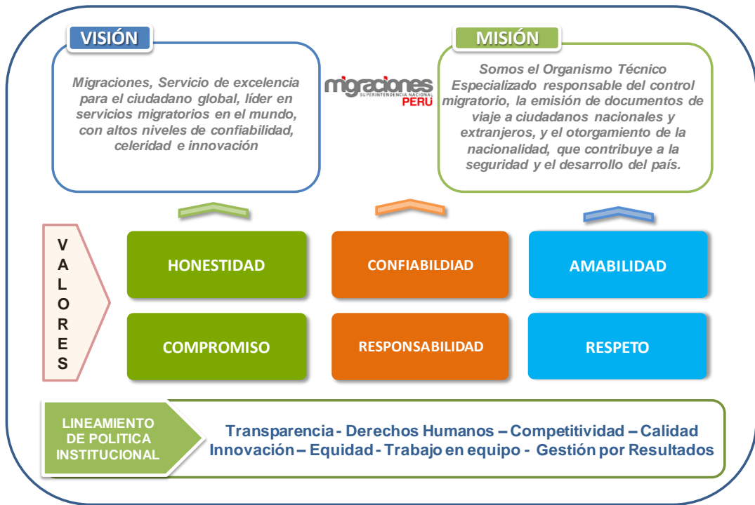
GRAFICO N° 3 MARCO ESTRATÉGICO INSTITUCIONAL