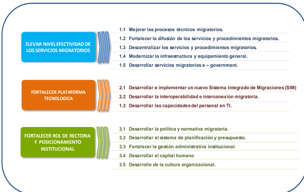
GRÁFICO N° 4 OBJETIVOS ESTRATEGICOS DE MIGRACIONES